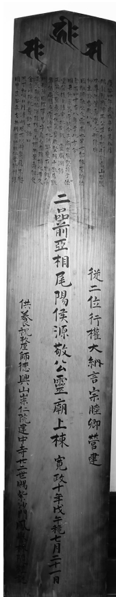
左一枚は御霊屋の棟札